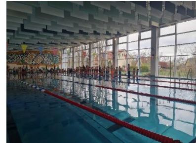
Foto: Teilnehmer des regionalen Schwimmwettkampfes vor Beginn der Wettkämpfe (Fr. Bochon)

Einen Herzlichen Glückwunsch an alle Teilnehmer. (hm)