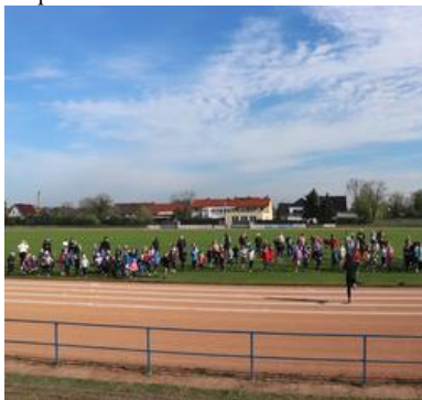
Foto oben: Sportfest (Fr. Bochon) Foto unten: Staffellauf (Fr. Bochon)