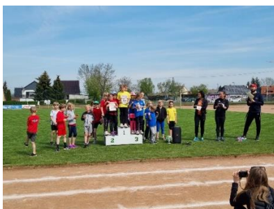
Fotos: Sieger der Staffelläufe beim Sportfest der Schule

des 5. und 6. Kurses unseres Jenaplanhauses. Unsere Fußballer und Fußballerinnen belegten einen tollen 2. Platz. Sie erzielten sogar den höchsten Sieg des Tages mit einem grandiosen 5:1. (hm)