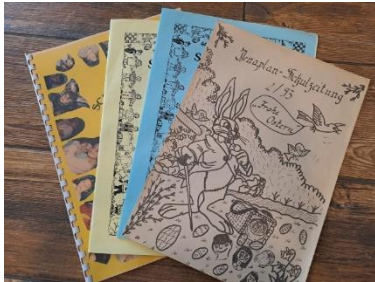
Foto: Alte Schülerzeitungen als Inspiration

Wir im Jenaplanhaus haben viele verschiedene Traditionen – Wochenendfeiern, Feste und vieles mehr. Eine Tradition möchten wir wiederbeleben ... eine regelmäßig erscheinende Schülerzeitung.